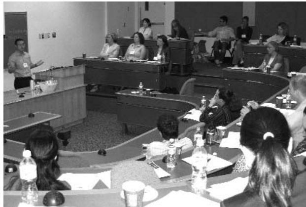
Des participants au symposium échangent leurs connaissances sur l'éducation juridique.

Le symposium a présenté un forum libre pour les établissements postsecondaires pour partager des renseignements et pour préparer de futures collaborations. Les programmes de sensibilisation uniques dans les écoles secondaires par plusieurs écoles de droit ont été mentionnés. Le programme de l'Université de Toronto intègre l'apprentissage juridique dans le curriculum ordinaire dans deux écoles secondaires de Toronto. Les programmes de l'Université McGill, Osgoode et d'Ottawa intègrent certains des éléments, ou tous les éléments du tutorat, mentorat, ateliers de droit et visites publiques. Les participants au symposium ont partagé des idées sur la collaboration et sur