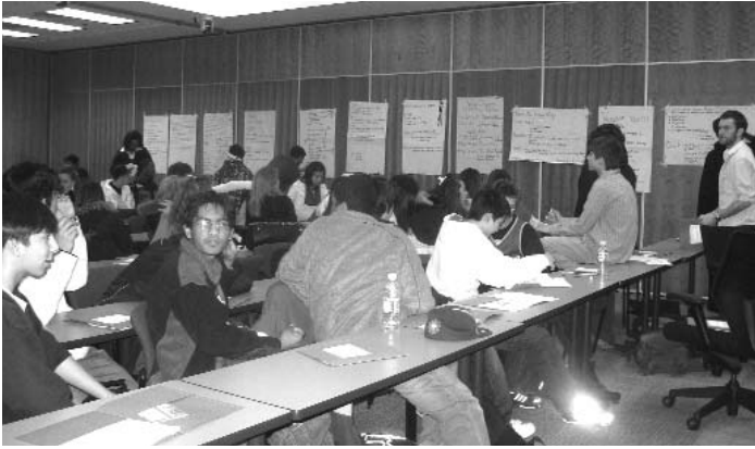
Des élèves partagent des idées de changement lors d'une activité du ROEJ sur les citoyens actifs.

L'intimidation, la violence chez les jeunes, la discrimination et l'amélioration des espaces communautaires ont été au centre de l'ordre du jour des élèves de citoyenneté de 10 e année, réunis le 18 avril 2007 pour discuter des façons de changer les choses dans leurs écoles et dans leurs quartiers. Cent élèves de Toronto ont pris part à l'activité du ROEJ sur les citoyens actifs et l'engagement des jeunes dans la justice sociale.