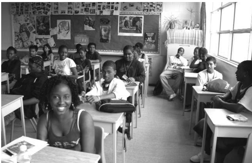
Des élèves d'ALS participent à l'éducation juridique à l'école secondaire centrale de Peel.

Un autre élève a dit : « J'ai aimé l'atelier parce que j'ai appris beaucoup de choses que je ne savais pas être d'usage au Canada. L'information sur les cliniques juridiques et l'aide juridique en Ontario était bonne. J'ai aimé qu'on nous dise comment trouver un avocat pour sa famille. Ce serait bon de recevoir la visite d'un avocat à l'école plus souvent. »