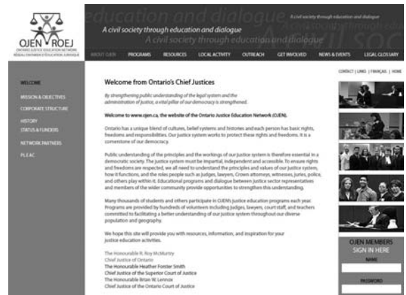
Le nouveau site Web du ROEJ est lancé.

Les changements vont au-delà de l'esthétique et visent à améliorer le site Web. Le contenu a été élargi et les fonctions de recherche permettent aux utilisateurs de trouver les ressources du ROEJ par mot clé et par sujet. Les nouvelles pages régionales et sur le rayonnement permettent aux visiteurs d'en apprendre davantage sur les activités locales et le travail de rayonnement du ROEJ. Les améliorations en cours comprendront des tableaux de discussion, des inscriptions aux visites de salles d'audience en ligne et des pages régionales. Allez voir les changements sur www.ojen.ca