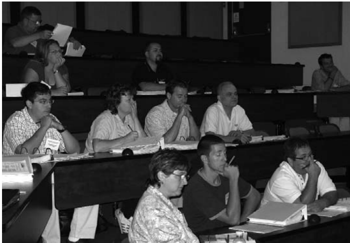
Les enseignants de toute la province participent au tout premier institut estival de droit du ROEJ en français.

Le ROEJ et l'Association des juristes d'expression française de l'Ontario (AJEFO) ont offert le tout premier institut estival de droit en français le 23 août au pavillon Fauteux de l'Université d'Ottawa. Cet événement a eu lieu en même temps que l'institut en anglais à Ottawa et a donné aux enseignants francophones de l'Ontario la chance unique de rencontrer des bénévoles francophones du secteur de la justice, de faire du réseautage et de partager des ressources.