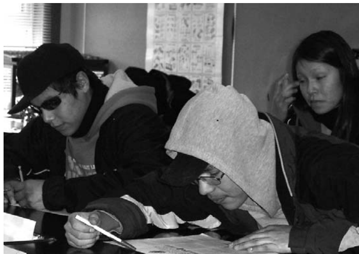
Les élèves au John C. Yesno Education Centre à Eabametoong prennent part aux activités liées à la Charte des droits et libertés .

Durant l'année scolaire 2006/2007, on élargira les activités du programme d'éducation juridique de tribunaux en circuit à toute la région NNA.