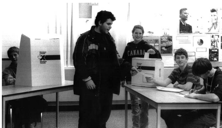
« Exercer ses droits » – photo de Lucas McDonald, participant au concours de photographie de l'ABO dans le cadre de la journée du droit.

Le ministère de l'Éducation de l'Ontario a été à l'avant-garde de ce mouvement au Canada. En 2000, il a établi un cours d'une demi-année d'éducation à la citoyenneté obligatoire en 10 e année. Ce cours tourne autour de trois grands thèmes : le citoyen avisé, le citoyen