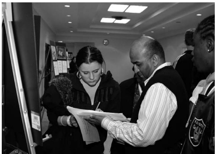
Un enseignant en droit aide les élèves à s'inscrire aux séances du symposium.

Après le discours de M. Borovoy, les élèves ont pris part à deux séances